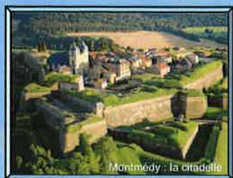
Montmédy : la citadelle