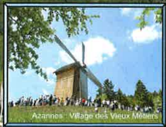
Azannes : Village des Vieux Métiers