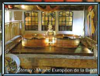
Stenay : Musée Européen de la Bière

Départ : Montmédy - Citadelle Sortir de la citadelle et prendre dir. Metz A gauche – RD 207 – Bazeilles-sur-Othain A droite – RD 208 – Flassigny Marville : entrer dans le village – puis prendre direction Delut Village Renaissance – cimetière St-Hilaire Base de Loisirs de l'Othain Delut – Vittarville puis tourner à gauche sur la RD 905 Damvillers : prendre 2 e route à droite puis direction Dun-sur-Meuse Eglise St-Maurice – Circuit J. Bastien-Lepage – statue par Rodin – cigognes Ecurey-en-Verdunois – Lissey – Bréhéville – Brandeville – Murvaux – Milly-sur-Bradon : direction Dun-sur-Meuse Côtes de Meuse Dun-sur-Meuse : au carrefour avec la RD 964, tourner à gauche vers centre-ville Eglise de Dun-Haut – port de plaisance Location de bateaux Place du Monument, tourner à droite direction Doulcon Doulcon : tourner à droite direction Sasse-sur-Meuse Lac Vert Plage – Centre Ipostéguy