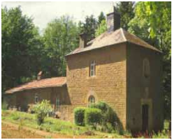
L'ermitage de Torgny

On dit que la place de Montquintin serait triangulaire parce que jadis s'y trouvaient concentrés les trois pouvoirs : le pouvoir de l'argent avec la ferme de la dime (actuellement le merveilleux Musée de la Vie Paysanne), le pouvoir de la terre représenté par la ferme du château et le pouvoir spirituel incarné par la petite église romane. Le musée et le panorama que l'on a sur la région depuis le cimetière valent réellement le détour.