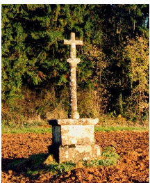
La croix des Aisements

A cet endroit, suivons tout droit le chemin qui descend vers le petit village encore très agricole de Couvreur. Un calvaire, la Croix des Déserteurs veille sereinement sur ce paysage immémorial. Nous sommes sur le chemin dit de la Messe qu'empruntaient jadis les habitants de Couvreur parce qu'ils n'avaient pas d'église dans leur village. La leur ne fut bâtie que tardivement en 1880 et n'est d'ailleurs toujours qu'une chapelle succursale de l'église de Montquintin. Du haut du chemin de la Messe,