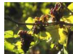
Les grappes vermeilles à l'heure de se laisser cueillir...

Au sortir du bois, nous allons tout droit en empruntant le chemin asphalté qui descend sur Torgny. Le point de vue que nous avons d'ici est également très beau : en face de nous, le village français de Velosnes surplombé par une pelouse calcaire appelée « La Ramonette » (le buis qui y pousse à profusion s'appelait jadis