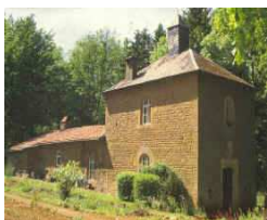
L'ermitage de Torgny