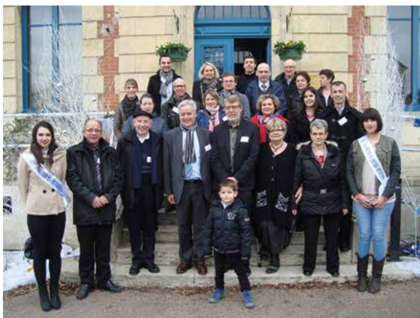
1 ère visite officielle à Guérigny le 13 décembre 2014.